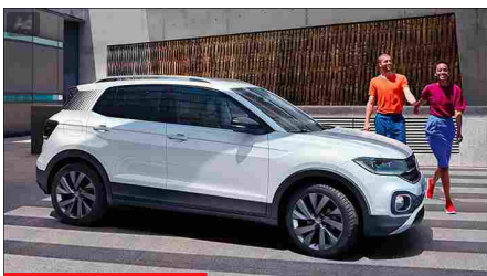
T-CROSS FIRST EDITION