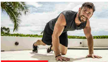
CHRIS HEMSWORTH, IL ...