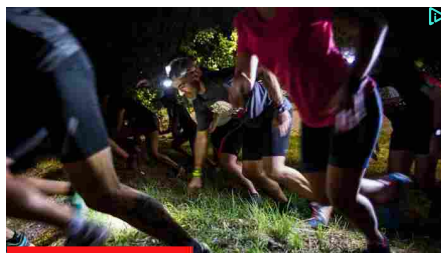
NEVER STOP MILANO: ...